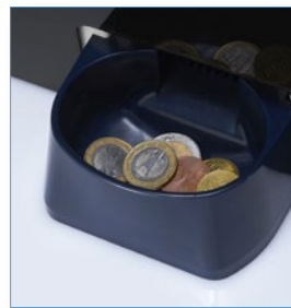
Wechselgeld wird automatisch und immer korrekt ausbezahlt.