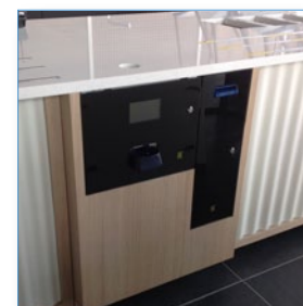
Restaurant mit Built-in Cashkeeper